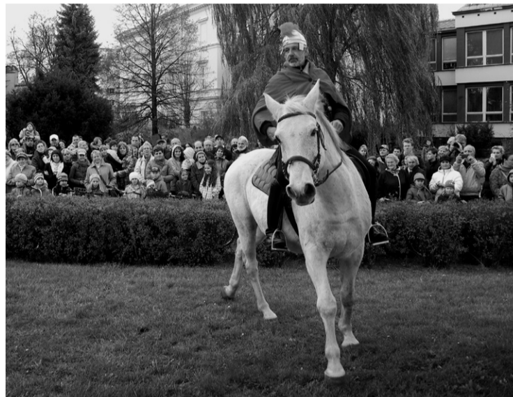
Před kostel sv. Martina přijel v neděli 10. listopadu v oděvu římského vojáka patron Krnova, svatý Martin, aby ze soucitu daroval žebračkovi polovinu svého pláště. Komentovaná scénka, stejně jako slavnostní svatomartinská mše, byly součástí Svatomartinských slavností, které pořádala místní organizace KDU-ČSL ve spolupráci s Římskokatolickou farností v Krnově.