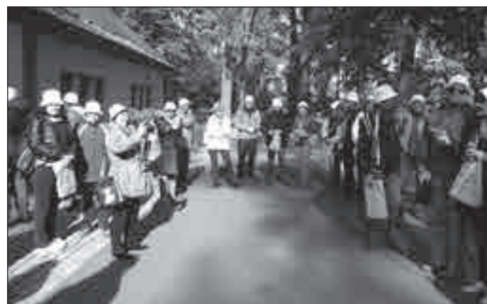
Komentovaný výšlap ke kostelu do Starého Města se konal na začátku října.