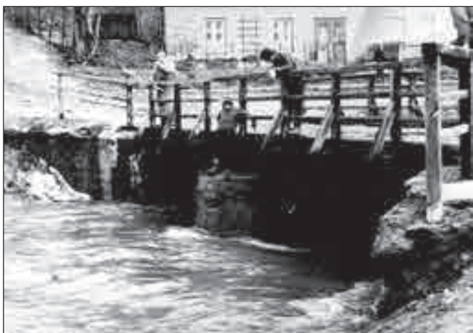
Most přes Černý potok.