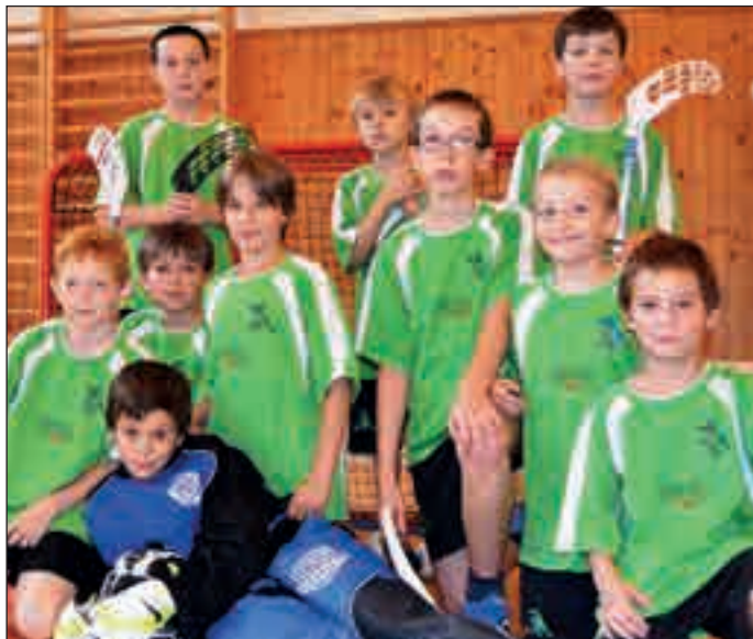
Florbal se na základních školách ve městě i okolí těší velké oblibě. Proto zorganizovali v ZŠ Okružní florbalovou ligu.