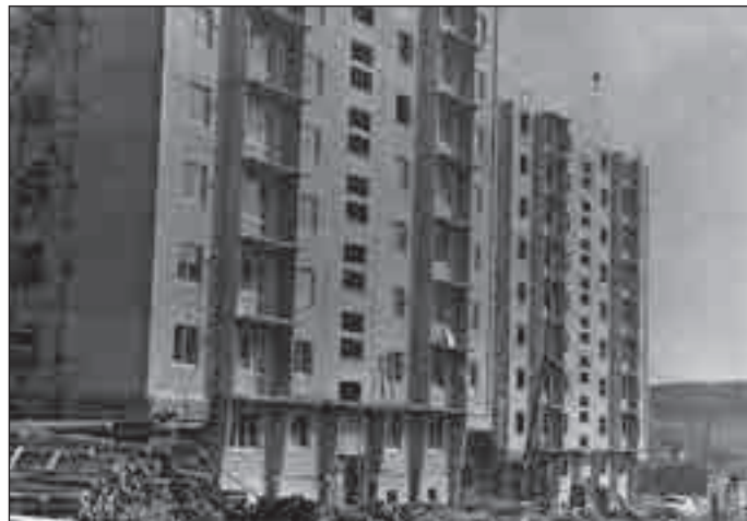
Výškové budovy v Pionýrské ulici.