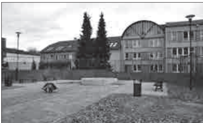
Současná podoba kašny v Cihelní ulici.

města. V roce 1947 bylo obnoveno jednání kolem projektu z roku 1928 na přívod vody z Karlova. Projekt byl několikrát přepracován a nakonec jako Skupinový vodovod Bruntál a okolí v roce 1949 schválen a v témže roce byla stavba po etapách zahájena.