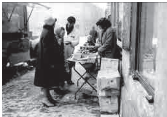
Venkovní prodej na náměstí.