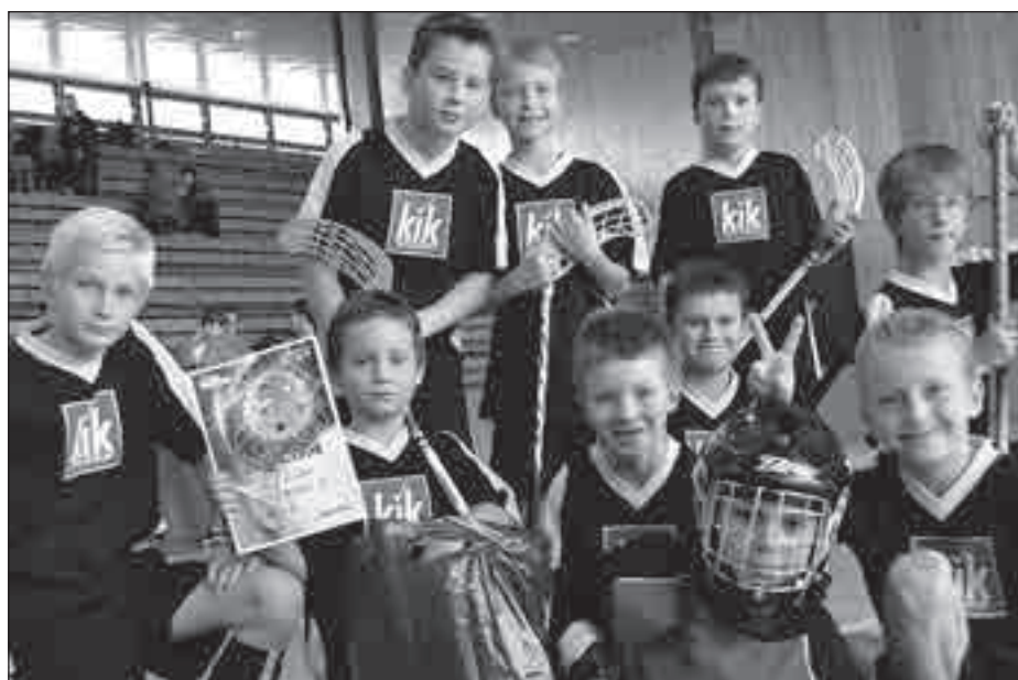
Nový florbalový oddíl FCB Panteri Bruntál má za sebou první úspěchy na turnajích Moravskoslezské ligy. Další domácí závody pořádají v březnu.