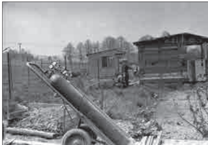
...osada Za Mlékárnou.