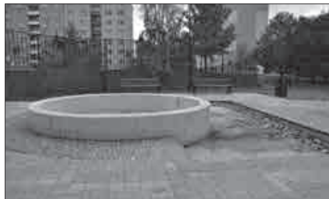
Kašna v Cihelní ulici spolu s brouzdalištěm.

ných řadů však nebylo provedeno v odpovídající kvalitě a ztráty systému se postupně neúnosně zvětšovaly. Po úpravách je voda z Karlova dodávána dodnes. Z kapacitních důvodů však bylo nutno řešit nový skupinový vodovodní řad z řeky Moravice u Leskovce nad Moravicí a nakonec i jeho obnovení z nově vybudované přehrady Slezská Harta. Tento zdroj je pro město Bruntál a okolí rozhodující i v roce 2013.