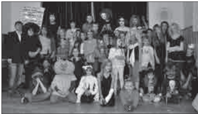
Kompletní halloweenská sestava v SVČ Bruntál.