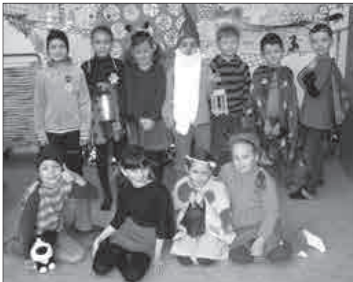
Na uspávání broučků se děti ze základní školy v Jesenické ulici důkladně připravily.

výroba světýlek a ukolébavky. Celý den byl završen vycházkou do parčíku a návštěvou vyzdobeného a osvětleného hřbitova. Děti v kostýmech broučků a se svítilí lucerničkou ozdobily podzimní krajinu a potěšily sebe, své kamarády i usmívající se kolemjdoucí. (EV)