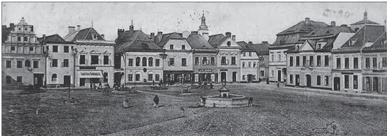
Původní kašna na Hlavním náměstí v Bruntále kolem roku 1900.

dojemem o obsahu 100 m 3 . Po roce 1945 byly do systému zapojeny hloubkové studny místních továren a v roce 1953 byl postaven nový vodojem u kasáren směrem na Rýmařov o kapacitě 500 m 3 . Tato stavba řešila pouze tlakové poměry ve vyšších částech