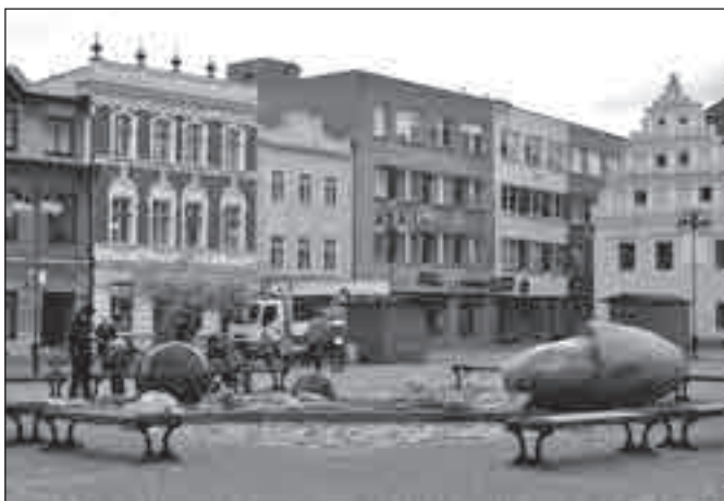
Současná podoba kašny (vodní prvek) na náměstí Míru.