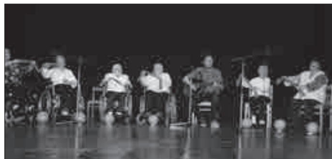
Senioři z bruntálského Domova Pohoda si připravili pro divadelní přehlídku v rámci polsko-českého projektu Senior vždy aktivní vystoupení na několik skladeb.

Podle slov obou preventistů se nedá přesně říct, kolik mají měsíčně případů k řešení, ale obecně se něco děje takřka každý den. „Přes léto je případů víc, to je pravda, třeba klasicky ty s alkoholem, nebo řešíme problémy s bezdomovci, občas