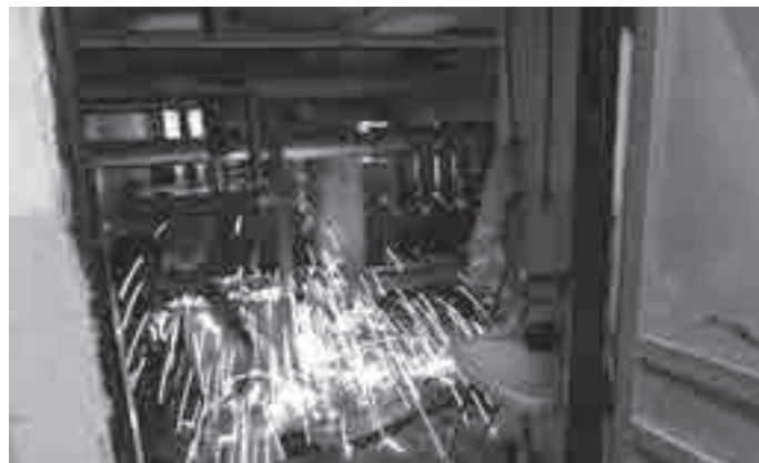
Práce v budově Petrína pokračují podle plánu.