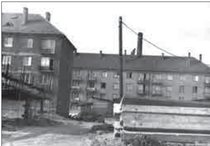
Nová výstavba změnila tvář Bruntálu.