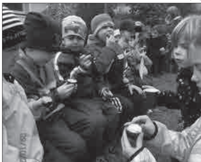
Opékání brambor bylo zážitkem pro děti ze školky i pro školáky.