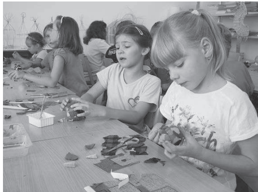
V umělcě se proměnila děti, které se od 4. do 8. srpna zúčastnily příměstského tábora s názvem Šikulové, který v ateliéru na Žižkově ulici pořádalo Středisko volného času Méda. Děti si vyzkoušely práci s keramikou, hlínou, korálkování, ze zbytků látek vrobily ptáčky, které si pak v kleci z proutě, stejně jako ostatní výrobky, odnesly domů, svůj prostor v týdením programu dostaly také zajímavé hry a návštěva aquaparku v Bruntěle.

parteru před památníkem Řekům usídleným v České republice a dále o trávník před gymnáziem, u kašiny s Neptunem a kolem sochy Bedřicha Smetany,“ uvedl Dušan Martiník z odboru životního prostředí. Na instalaci automatického závlahového systému naváže položení trávníků a další činnosti, které skončí do konce roku. Smetanovy sady procházejí od loňského června zásadní rekonstrukcí. Stavební práce za téměř 25 milionů korun, které jsou až na závlahové systémy hotové, zahrnovaly obnovu komunikací, úpravy významných míst v parku, obnovu laviček, odpadkových košů a dalšího mobiliáře, instalaci nového veřejného osvětlení, vodovodních přípojek, šachet, fontán a také vybudování dvou dětských hrášť. (dc)