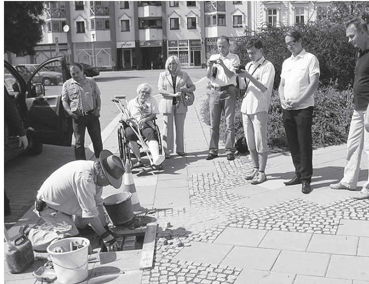
Německý umělec Gunter Demnig položil v pátek 19. července v Krnově dvanáct mosazných destiček s dvanácti jmény obětí holocaustu z Krnova. Kameny zmizelých se nacházejí na čtyřech místech: u sídla kriminální policie na Mikulášské ulici, naproti vstupu do Městské kavárny na Hlavním náměstí, před internátem Střední školy průmyslové na Soukenické ulici a u vstupu do synagogy. (Více na str. 4)

Cyklostezka vede většinou po parcelách zemědělského půdního fondu, z nichž část pozemků je v majetku města Krnova. Velký díl je ale v soukromém vlastnictví a jen souhlas majitele pozemků umožnil zahájení projektové činnosti, provedení stavby a následné užívání. Po dokončení výstavby na tyto soukromé úseky upozorní dopravní značky. (dc)